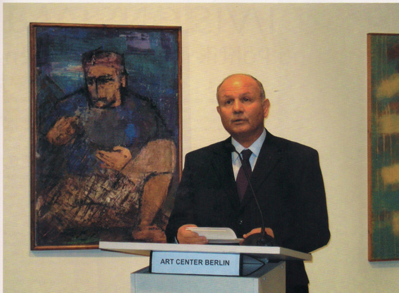
Tunesiens Botschafter Moncef Ben Abdallah bei der Eröffnung der Ausstellung